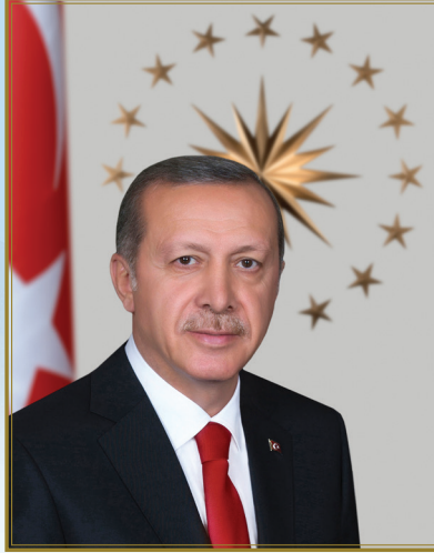
TÜRKİYE CUMHURİYETİ CUMHURBAŞKANI SN. RECEP TAYYİP ERDOĞAN